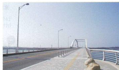
ダクタイル鋳鉄製