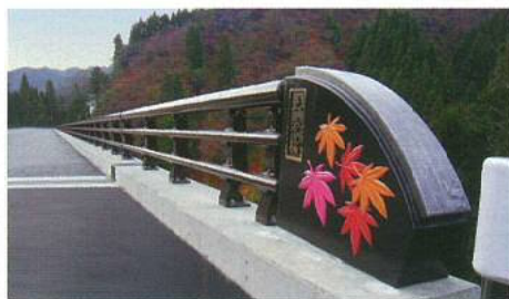
ダクタイル鋳鉄製