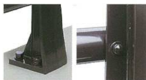
設計思想はボルト1本まで反映