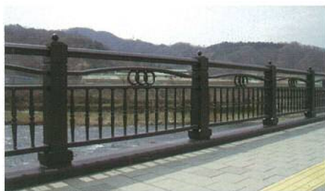
ダクタイル鋳鉄製